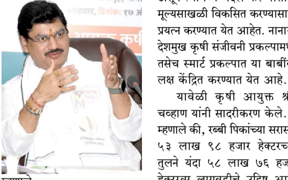
कृषी मंत्री धनंजय मुंडे यांच्या अध्यक्षतेखाली राज्यस्तरीय रब्बी हंगामपूर्व आढावा बैठक २०२३-२४ साखर संकुल येथे आयोजित करण्यात आली होती.

दावे लागेल. रब्बी हंगामात उत्पादनात वाढ होईल याबाबत अधिकाऱ्यांनी आत्मविश्वासाने काम करावे, असेही त्यांनी सांगितले. यंदा काही विभागात धरणातील पाणीसाठ्याची परिस्थिती गंभीर असल्याने उन्हाळी आवर्तने देणे कठीण आहे. त्यामुळे हे क्षेत्र रब्बी पिकांच्या, चारा पिकांच्या उत्पादनाकडे वळविण्यासाठी प्रयत्न करावा. करडई, जवस, तीळ, मोहरी, पिवळी ज्वारी आदी कमी लागवड असलेल्या तृणधान्य, गळीत धान्याच्या लागवडीला प्रोत्साहन देऊन शेतकऱ्यांना या उत्पादनांना चांगला भाव मिळेल याची हमी दिली पाहिजे. त्या अनुषंगाने प्रस्ताव तयार करावा, असे निर्देश कृषी मंत्री श्री. मुंडे यांनी दिले. राज्यातील भरड धान्य उत्पादनांना व्यापक बाजारपेठ उपलब्ध करण्यासाठी कृषी उद्योग महामंडळाने त्यांचे ब्रॅण्डिंग करून ऑनलाईन प्लॅटफॉर्म उपलब्ध करावा तसेच मेझॉनसारख्या ई-व्हिझनेस प्लॅटफॉर्मशी जोडणी करावी, असेही ते म्हणाले. यावेळी कृषी सहसंचालकांक डू न विभागनिहाय रब्बीची पेरणी, पाण्याची परिस्थिती, बियाणे उपलब्धता, खते उपलब्धता याबाबत आढावा घेतला. खतांचे लिकिंग होणार नाही याकडे कटाक्षाने लक्ष द्यावे, असे कृषी मंत्री