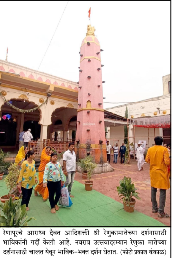
रेणापूरचे आराध्य दैवत आदिशक्ती श्री रेणुकामातेच्या दर्शनासाठी भाविकांनी गर्दी केली आहे. नवरात्र उत्सवादरम्यान रेणुका मातेच्या दर्शनासाठी चालत येवून भाविक-भक्त दर्शन घेतात.