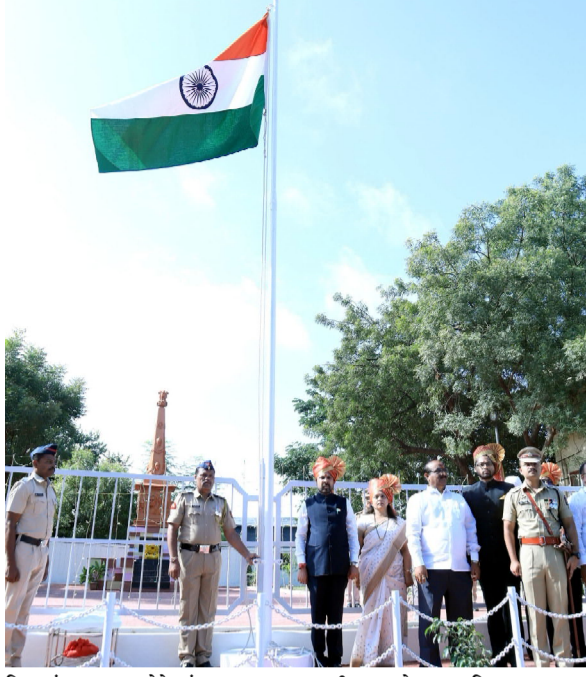
लि. यांचा ना. बनसोडे यांच्या सन्मान करण्यात आला. तसेच लातूर शहर महानगरपालिकेच्या ताप्यात नव्याने सामील झालेल्या अग्निशमन वाहन, फिरते शौचालये आदीचे लोकार्पण यावेळी करण्यात आले.

प्रधानमंत्री टीबी मुक्त भारत अभियानामध्ये सहभागी होत लातूर शहर टी बी युनिट अंतर्गत २०० क्षयरुग्ण दत्तक घेवून त्यांना ६ महिन्यांसाठी आवश्यक १२०० फूडबास्केटचा पुवठा करणाऱ्या लातूर एमआयडीसी येथील एडीएम एमो अँड विझाग प्रा.