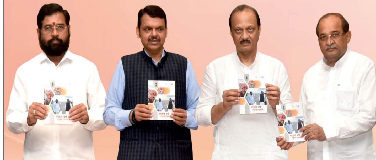
एकनाथ शिंदे मुख्यमंत्री